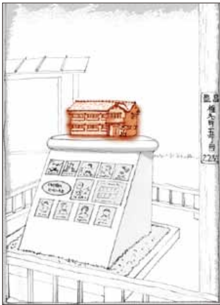
① 記念碑「トキワ荘のヒーローたち」